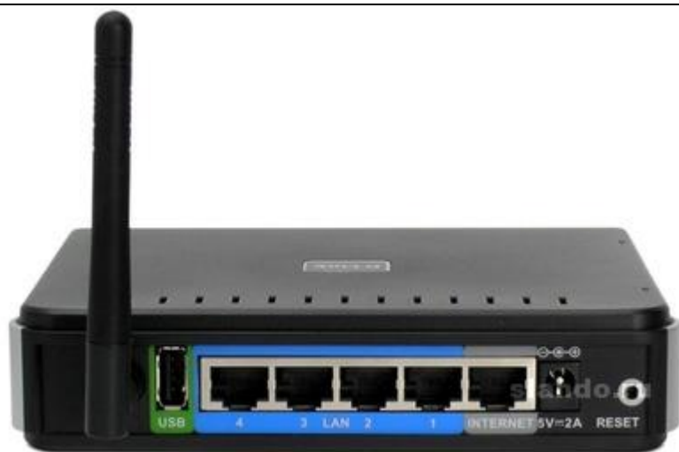
Рис. 10. Беспроводной маршрутизатор

длину кабеля, количество подключенных устройств или количество повторителей на сетевой сегмент.