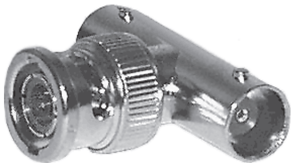
Рис. 1. Т-коннектор

Аппаратура локальной сети обычно состоит из кабеля, разъемов, Т-коннекторов (рис. 1), терминаторов и сетевых адаптеров. Кабель, очевидно, используется для передачи данных между рабочими станциями. Для подключения кабеля используются разъемы. Эти разъемы через Т-коннекторы подключаются к сетевым адаптерам - специальным платам, вставленным в слоты расширения материнской платы рабочей станции. Терминаторы подключаются к открытым концам сети.