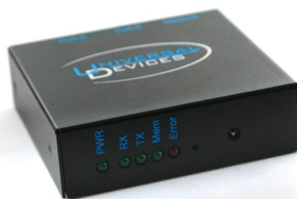
Рис. 11. Мосты (Bridge)-

8. Шлюзы (Gateway) - программно-аппаратные комплексы, соединяющие разнородные сети или сетевые устройства. Шлюзы позволяет решать проблемы различия протоколов или систем адресации. Они действует на сеансовом, представительском и прикладном уровнях модели OSI.