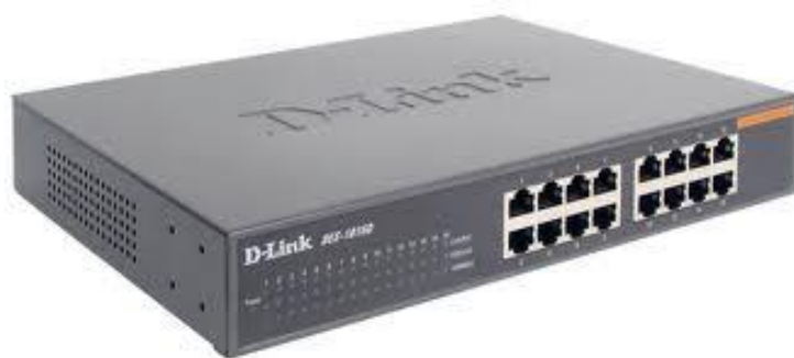
Рис. 7. Концентратор с фиксированным ко-