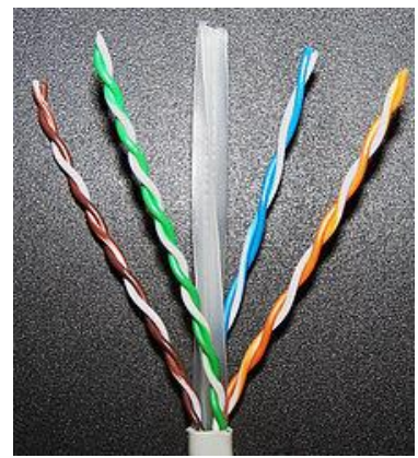
Рис. 3 Кабель на основе витой пары

1. Витая пара (TP - Twisted Pair)– это кабель, выполненный в виде скрученной пары проводов (рис. 3). Он может быть экранированным и неэкранированным. Экранированный кабель более устойчив к электромагнитным помехам. Витая пара наилучшим образом подходит для малых учреждений. Недостатками данного кабеля является высокий коэффициент затухания сигнала и высокая чувствительность к электромагнитным помехам, поэтому максимальное расстояние между активными устройствами в ЛВС при использовании витой пары должно быть не более 100 метров.