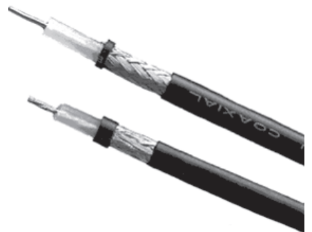
Рис. 4. Устройство коаксиального кабеля

2. Коаксиальный кабель (рис. 4) состоит из одного цельного или витого центрального проводника, который окружен слоем диэлектрика. Проводящий слой алюминиевой фольги, металлической оплетки или их комбинации окружает диэлектрик и служит одновременно как экран против наводок. Общий изолирующий слой образует внешнюю оболочку кабеля.