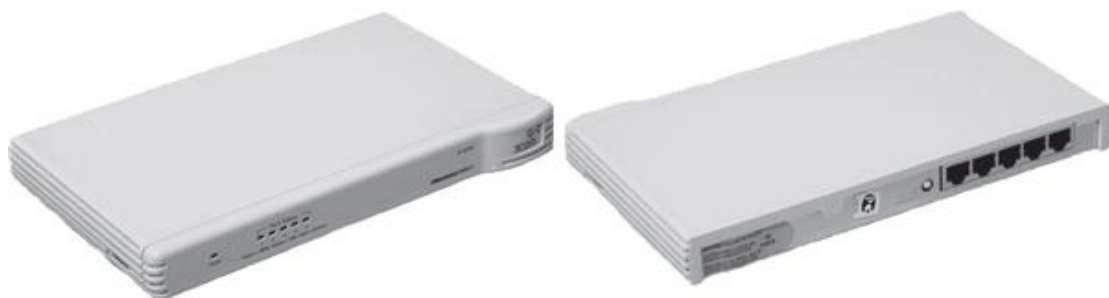
Рис. 9. Коммутатор

Использование коммутаторов является более дорогим, но и более производительным решением. Коммутатор обычно значительно более сложное устройство и может обслуживать одновременно несколько запросов. Если по какой-то причине нужный порт в данный момент времени занят, то пакет помещается в буферную память коммутатора, где и дожидается своей очереди. Построенные с помощью коммутаторов сети могут охватывать несколько сотен машин и иметь протяженность в несколько километров.