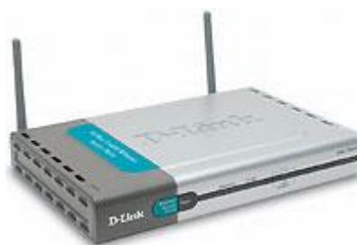
Рис. 12. Точка доступа

Радиохарактеристики точки доступа во многом определяются тем, какие антенны используются. Так, одну и ту же точку доступа с разными антеннами можно использовать для решения разных задач. Если, к примеру, точка доступа применяется в качестве радиомоста между зданиями, удаленными на 2 км или более (до 25 км), то предпочтительнее установить направленную антенну.